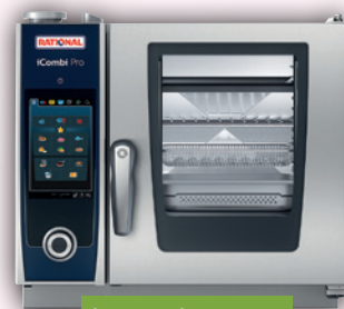
iCombi Pro XS

Mit Option: iCareSystem AutoDose für iCombi Pro 10-1/1 und 6-1/1 Tischgeräte Mit iCareSystem AutoDose ist die Reinigung auf Wunsch völlig autonom: Sie startet nach vorgegebenem Zeitplan und nimmt sich vom integrierten Feststoffreiniger genau die Dosis, die für hygienische Sauberkeit notwendig ist.