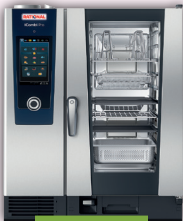
iCombi Pro 10-1/1