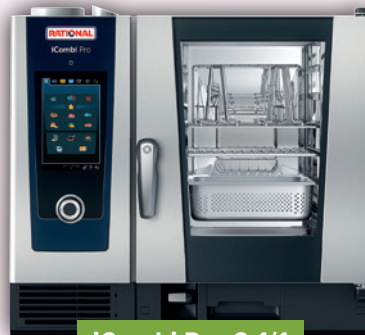
iCombi Pro 6-1/1